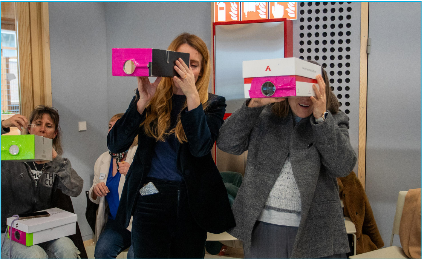
Formació docent Photo-Interval d'Antonio Pérez.