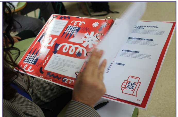
Lliurament de Quadern de Gestió - IES Guillem D'Alcalà.

Els centres triats finalment es comprometen a: