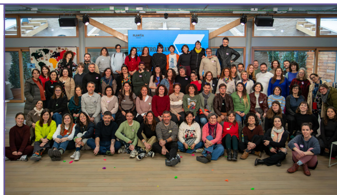
Trobada Estatal PLANEA 2026.

PLANEA és una xarxa de centres educatius, agents i institucions culturals que utilitzen les pràctiques artístiques de manera transversal, situada en el territori i amb vocació de generalització i permanència en l'escola pública.