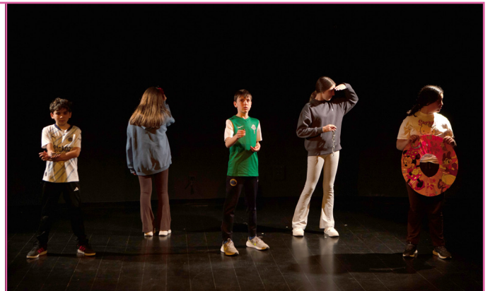
La Morsa, Centre del Titella d'Alcorcón.

La participació en PLANEA és totalment voluntària, gratuïta i conscient de les dificultats organitzatives i pedagògiques dels centres educatius públics.