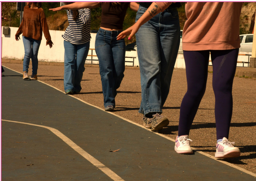
CEIP As Covas - Meaño.

La intenció d'esta nova fase de PLANEA és consolidar aprenentatges i oferir un model concret des del qual pensar les relacions entre art i escola de manera experimental i situada. El que hem anomenat "full de ruta PLANEA" integra un itinerari coordinat per als centres de nova incorporació a la xarxa.