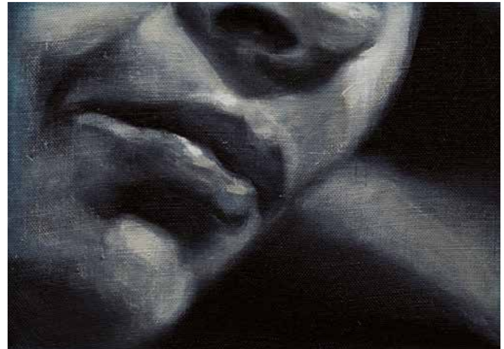
Traços d'una veu. Mery Sales