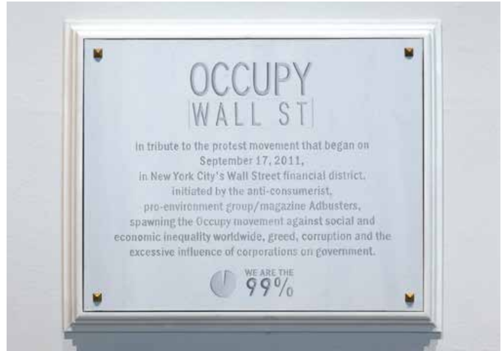
À la Victoire de... Tania Blanco