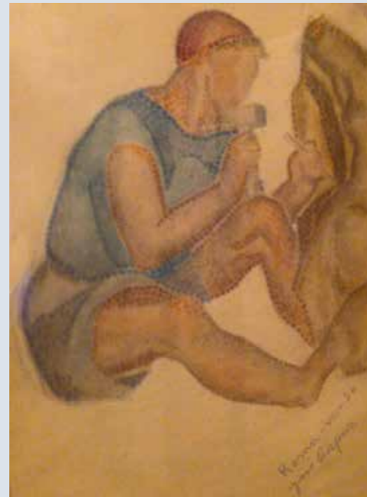
Escultor romano, 1907-1912. Roma