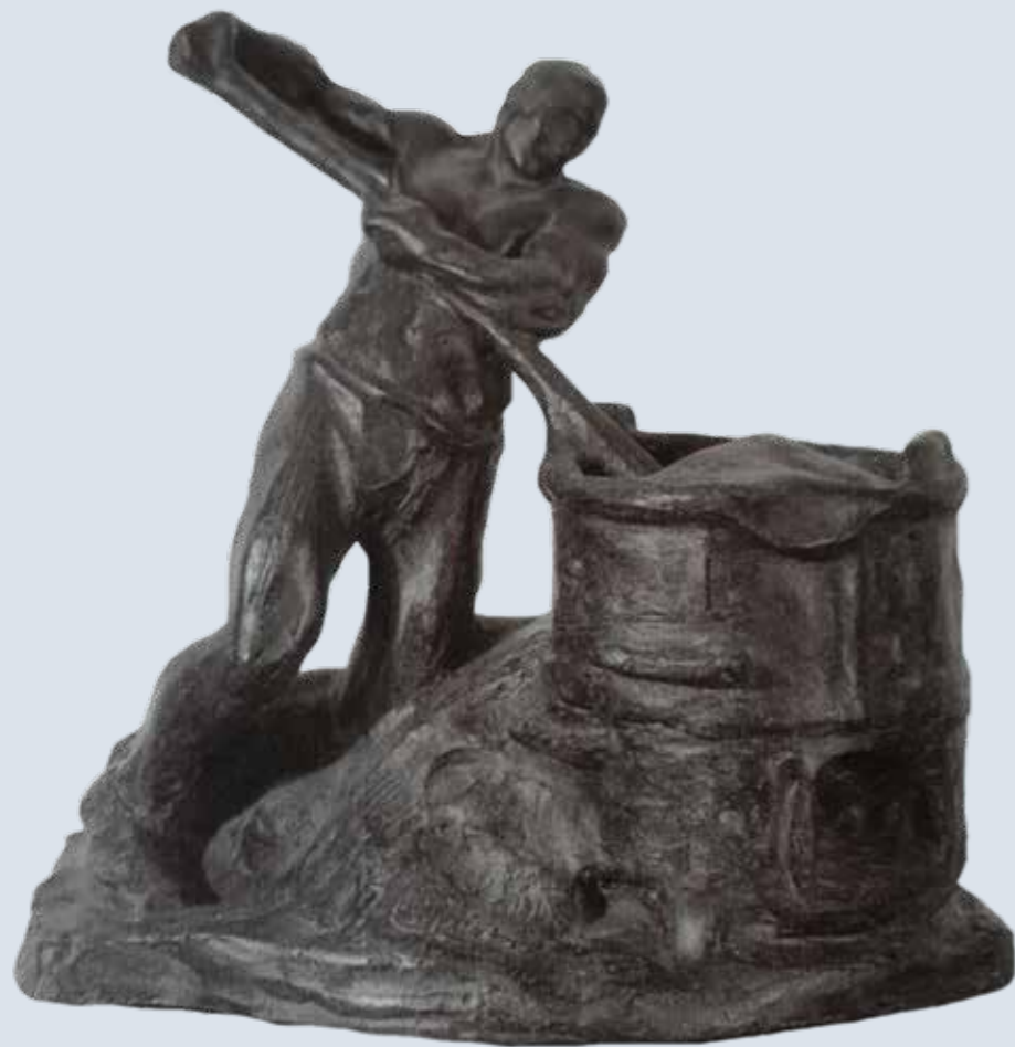
El trabajo (Obrero), 1909 Museu de Belles Arts de València

de Maillol y su idealización de la belleza; la monumentalidad y el arcaísmo de Bourdelle; la estilización y emotividad del croata Mestrovic, así como referentes cubistas o del arte déco, el primitivismo y lo exótico subyacen en las creaciones de este artista, artífice de formas puras que siempre admiró la escultura clásica griega, la obra de Miguel Àngel y la imatgeria renaixentista y barroca española. El reconocimiento del mérito artístico de José Capuz por parte de sus contemporáneos traspasó nuestras fronteras. Pero, en la actualidad, algo difuminado su nombre por el paso del tiempo, y considerado por la historiografía reciente como más clásico que moderno, se hacía necesario visitar al artista para mantener vivo su legado. Su obra representa un nuevo y firme eslabón en la reconocida e histórica escuela escultórica valenciana y un hito en la escultura española de la época.