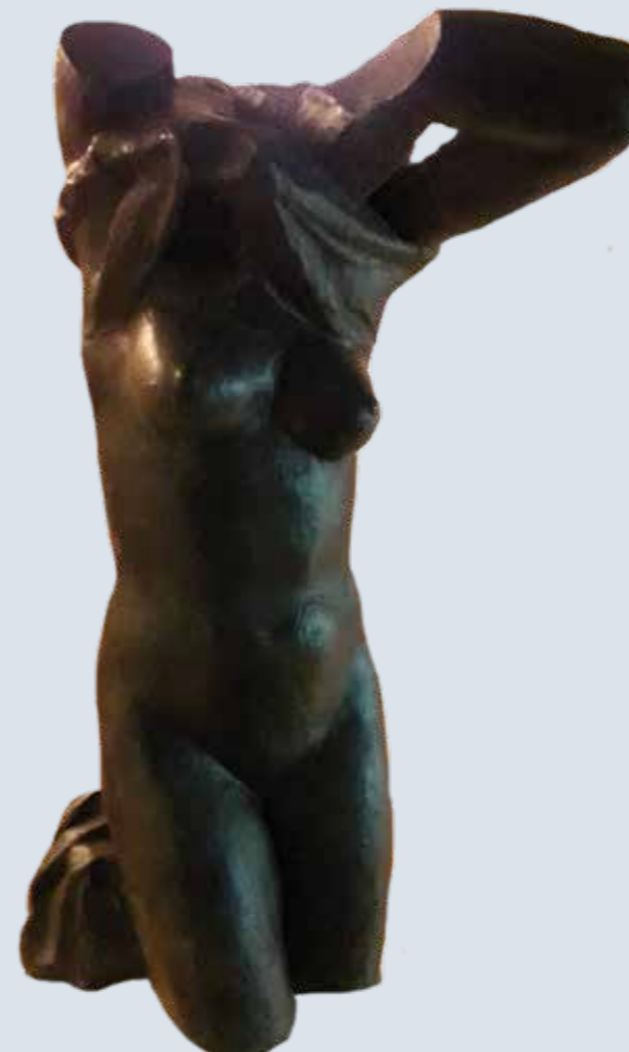
Torso desnudándose, ca.1950 Museu de Belles Arts de València