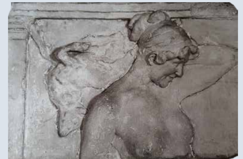
Diana cazadora, 1909 Museu de Belles Arts de València