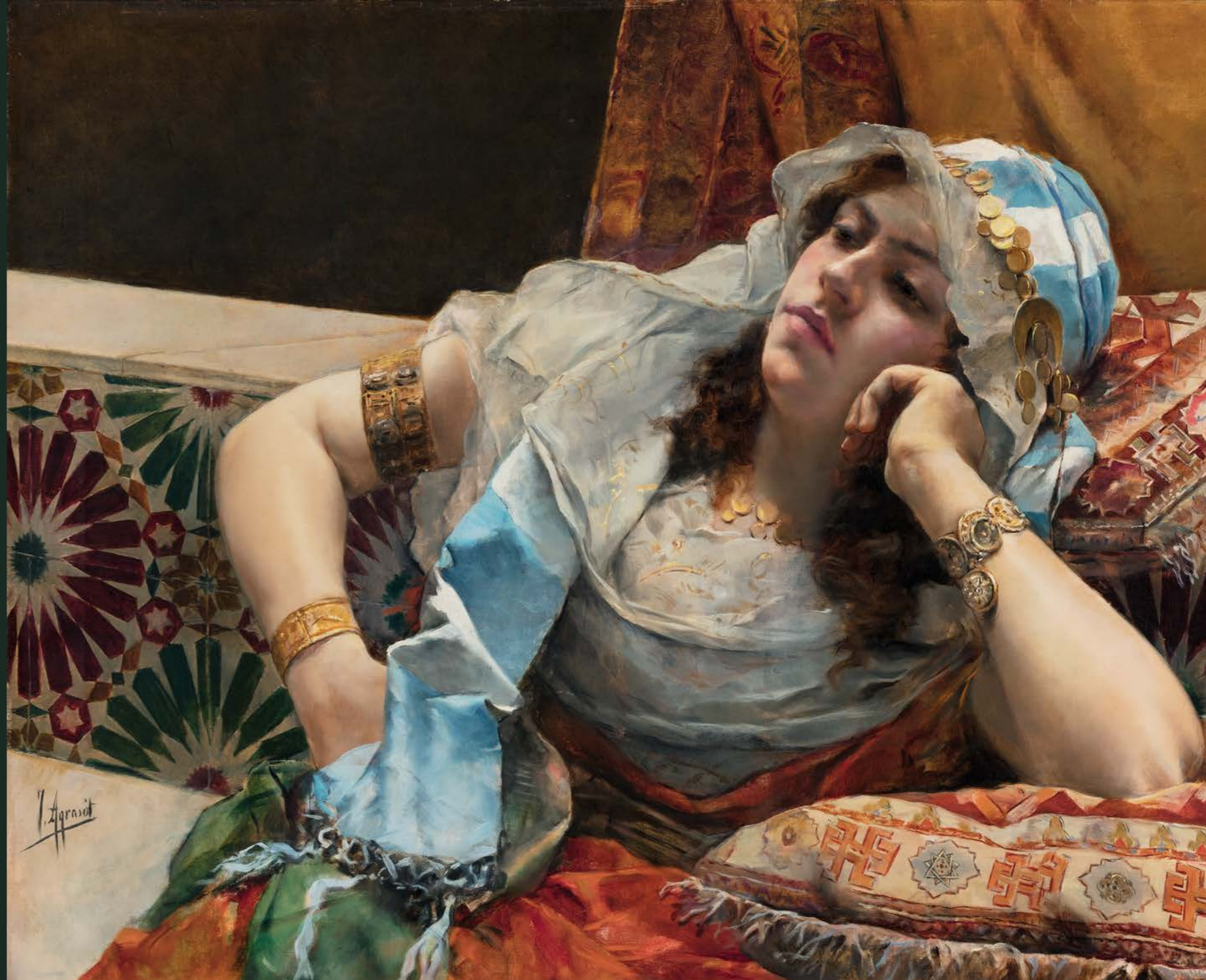
Odalisca , 1890-1910 Col. particular