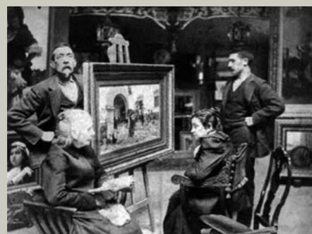
Fotografías personales Fotografías personales de Joaquín Agrasot (1923-42)

Ahora pues, apenas un año después del centenario de su defunción, es el momento de recuperar al artista oriolano, para mostrarlo desde las distintas disciplinas artísticas que trabajó a lo largo de su dilatada vida.