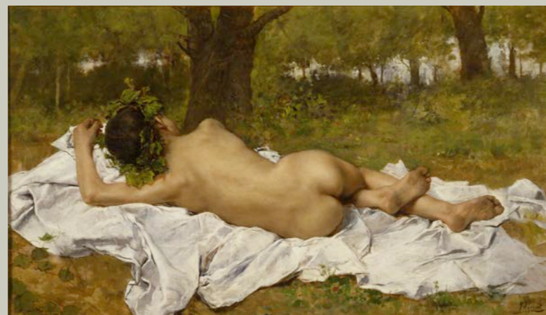
Baco joven , 1872 Museo de Bellas Artes de València

En 1902, la Encyclopaedia Britannica resumía de forma rotunda la situación de la pintura española de la segunda mitad del siglo XIX. Consideraba que la pintura moderna en España comenzaba con Mariano Fortuny (1838-1874), quien habría de dejar su marca en las siguientes generaciones de pintores. Y destacaba solamente a un artista durante los años de 1870, Joaquín Agrasot y Juan (1836-1919), quien pintó con gran sinceridad imágenes de la vida española cotidiana. Y, concluía que, ya para finales del siglo, dos jóvenes artistas aparecieron con energía: Joaquín Sorolla (1863-1923) e Ignacio Zuloaga (1870-1945).