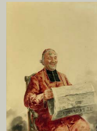
Cardenal leyendo , ca. 1870