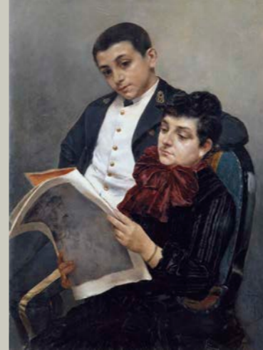
La esposa y el hijo del pintor , 1886 Museo de Bellas Artes de València

Ara, a penes un any després del centenari de la seua mort, és el moment de recuperar l'artista oriolà, per a mostrar-lo des de les diferents disciplines artístiques que va treballar al llarg de la seua dilatada vida.