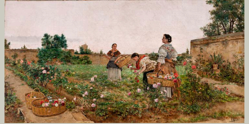
Mujer cogiendo flores , 1895. Museo de Bellas Artes de Bilbao