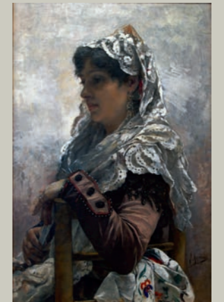
Valenciana con mantilla o Retrato de valenciana , ca. 1886 Museo Nacional de Cerámica "González Martí"