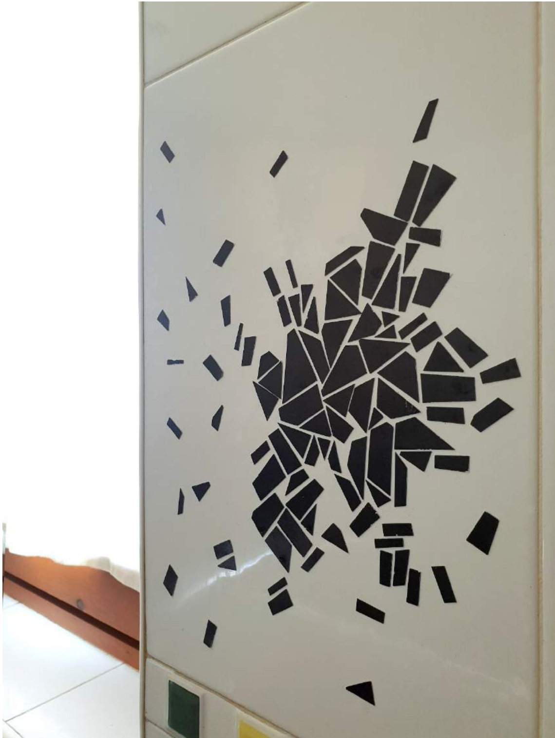
Intervención sobre azulejo de cocina.