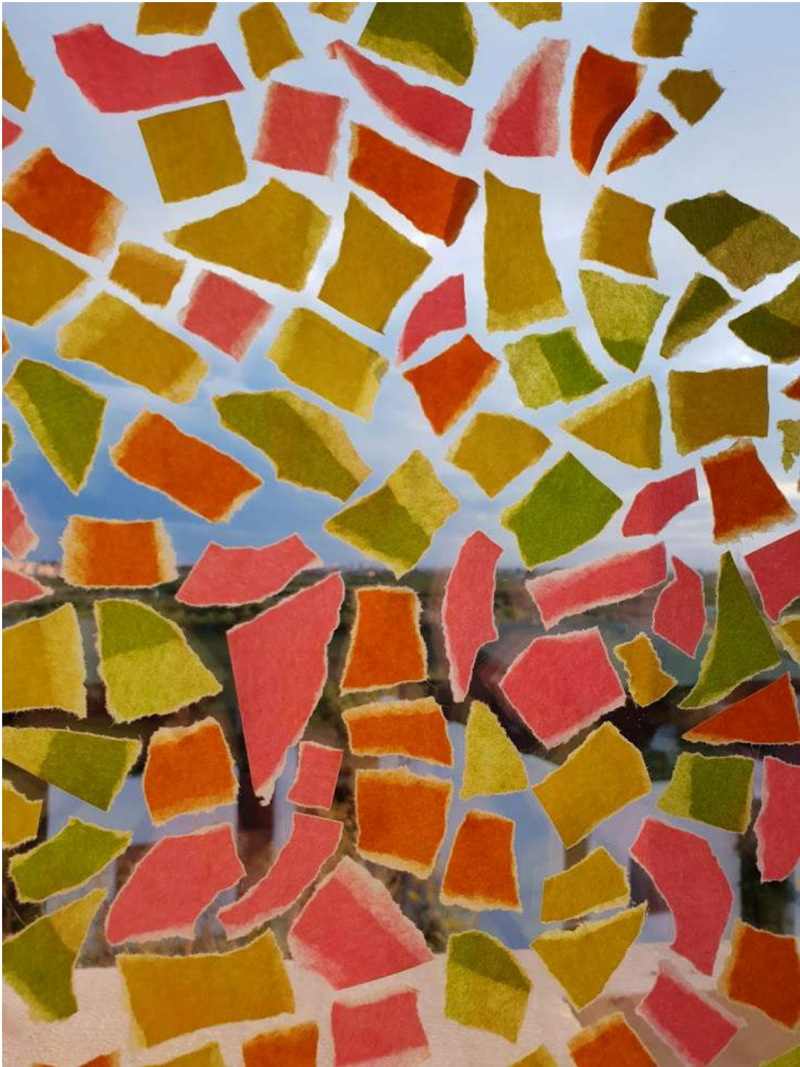
Intervención sobre cristal