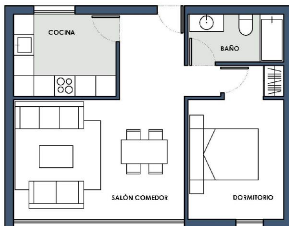
Exemple d'habitatge de 1 dormitori