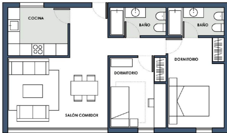
Exemple d'habitatge de 2 dormitoris

L'habitatge és aquest espai en el qual habitem, que coneixem tan bé, i al qual poques vegades dediquem l'atenció que es mereix. Observarem detingudament el nostre habitatge. Quants dormitoris té? I banys? La cuina està separada del saló-menjador, o forma part de la mateixa estada?