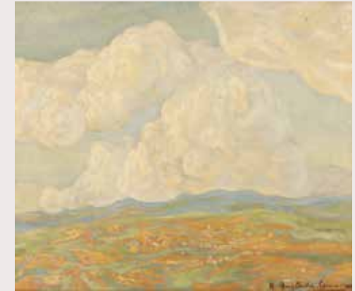
Hermén Anglada Camarasa Paisaje desde Montserrat , 1938 Óleo sobre lienzo, 44 x 51 cm

El segle XIX al nostre país ve marcat per la invasió napoleònica, que va originar una evolució en la mentalitat i en els esdeveniments polítics i socials, els quals tenen una influència directa en l'àmbit cultural. Aquests canvis fan que apareguen noves condicions per a la vida artística, que marcaran profundament el seu futur desenvolupament.