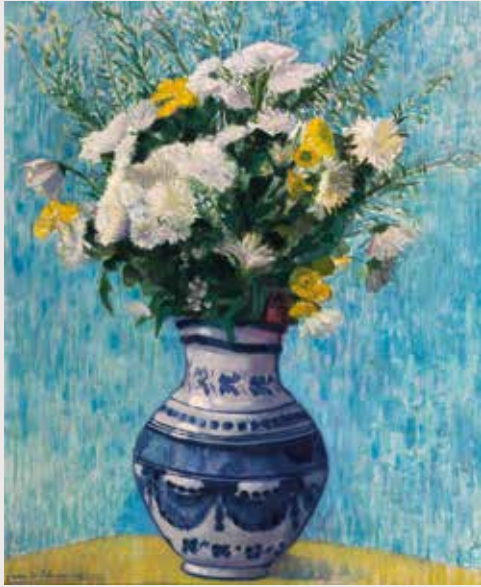
Juan de Echevarría Florero , c. 1920 Oli sobre tela, 65 x 54,5 cm