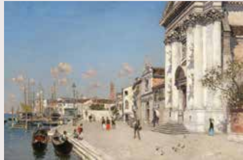
Martín Rico Ortega Santa María del Rosario, Venecia , c. 1900 Oli sobre tela, 46 x 69 cm