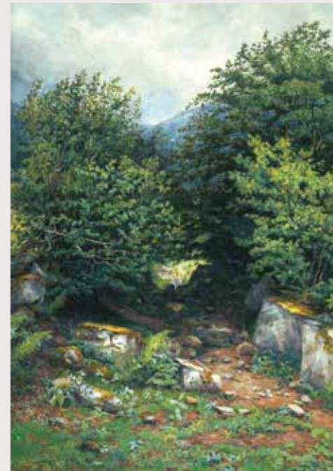
Emilio Sala Paisaje de la sierra de Guadarrama , s.d. Gouache sobre papel, 110 x 78 cm